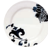
Assiette plate extra (x 4) Dinner plate Eßteller Ø 27,4 cm B4A450 10 3 4 dia