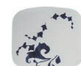
Coupe nuage M.M. (x 1) Organic square plate medium Gourmet Platte mg 24,5 x 21,2 cm CCNM83 9 11 16 x 8 3 16