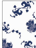
Torchon (x 4) Tea towel Geschirrtuch 100% coton 50 x 70 cm 8003INTO04 19 11 16 x 27 5 16