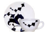
Tasse, soucoupe à déjeuner (x 2) Breakfast cup and saucer Frühstückstasse mit Untere 26 cl - Ø 18 cm 2PTA01 Cup 11 oz. 4 10 16 dia Saucer 7 10 16 dia