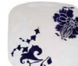
Coupe nuage G.M. (x 1) Organic square plate large Gourmet Platte 29,5 x 26,5 cm CCNU83 11 5 16 x 10 11 16