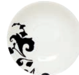
Assiette gourmande (x 4) Soup/Pasta plate Teller tief Ø 22 cm B6AY02 8 11 16 dia