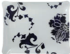
Plateau G.M. acrylique (x 1) Acrylic serving tray large Tablett groß 48 x 38 cm 8005INGMPL 18 7 8 x 15"