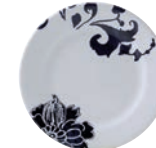
Assiette dessert (x 4) Dessert plate Dessertteller Ø 22 cm B4BB50 8 11 16 dia