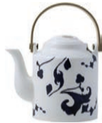
Théière Japonaise (x 1) Anse en frêne et en noyer Japanese Teapot Japanische Teekanne 90 cl CTJA00 30 7 16 oz