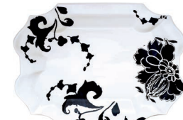
Plat de service (x 1) Serving platter Servierplatte 45 x 36 cm CPL131 17 3 4 x 14 11 16