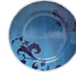
Assiette dessert (x 4) Dessert plate Dessertteller Ø 22 cm B4AB50 8 11 16 dia