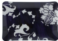
Plateau P.M. acrylique (x 1) Acrylic serving tray small Tablett klein 30 x 22 cm 8005INPMPL 11 13 16 x 8 11 16